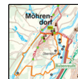
Karte am Ende des Dokuments in höherer Auflösung.