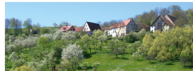
Lillinghof (16.04.2005, up3)

Es geht bergan, oben rechts auf den Panoramaweg – und vom Rödlas bis zum Moritzberg reicht der Blick. Oedhof . Links der Beschilderung „Lillinghof“ nach und kurz darauf rechts. Steiler und steiler wird's und wir kraxeln hoch, immer unserer 8 nach durch den Wald. Bei den Wochenendgrundstücken nicht nach rechts, sondern geradeaus.