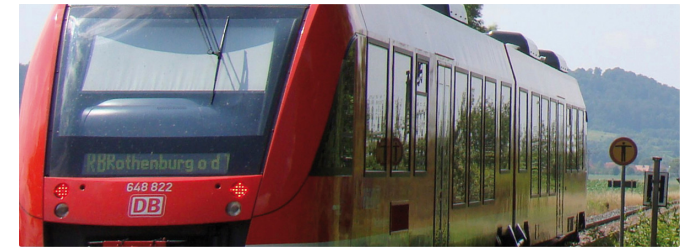
Die Mittelfrankenbahn auf dem Weg nach Rothenburg

Bevor wir gen Westen ins Innere der Rothenburger Landwehr losziehen, genießen wir den Blick nach Osten, auf die Ausläufer der Frankenhöhe. Am nördlichen Ende der Bergkette thront der Endseer Berg – ein Natur-Kleinod, eine geologische Schatztruhe und unser Ziel.